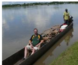
(Motorkanu Sepik River / Beispiel)

Von Wewak fahren Sie entlang der Prinz Alexander Bergkette und dann hinab zum Sepik River. In Pagwi warten motorisierte