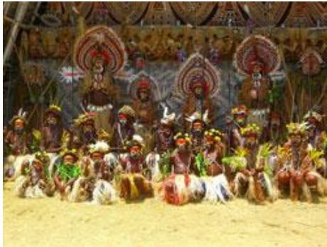
(Culture Show Maprik)

Nach dem Frühstück verlassen Sie Yaumbek, fahren den Sepik abwärts nach Pagwi und von dort mit dem Wagen zurück nach Wewak, wo Sie im Laufe des Nachmittags eintreffen.