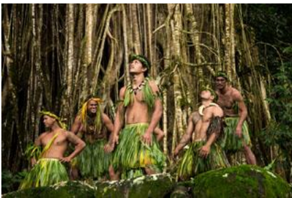
(Tanzvorführung / Kamuihei)

Sie teils rätselhafte Darstellungen von Vögeln, Schildkröten und Fischen sowie wichtigen Personen, denen so vor Hunderten von Jahren ein Denkmal gesetzt wurde. Einen seit Jahrhunderten überlieferten Tanz werden Sie im Schatten eines mächtigen Banyanbaums erleben können. Im Dorf Hatiheu besuchen Sie die kleine Kirche sowie das Grab des letzten Häuptlings der Region.