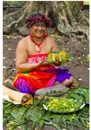
(Anfertigung von Blumenschmuck)

Fatu Hiva gilt als eine der romantischsten und landschaftlich schönsten Marquesas-inseln. Sie besuchen die Orte Omoa und Hanavave, hier finden sich zahlreiche Kunsthandwerker, die ihre kunstvollen Schnitzarbeiten anbieten. Frauen produzieren aus Baumrinde die traditionellen Tapas: kunstvoll bemalte Kleidungsstücke, die noch heute zu festlichen Anlässen getragen werden, sowie dekorativer Wandschmuck.